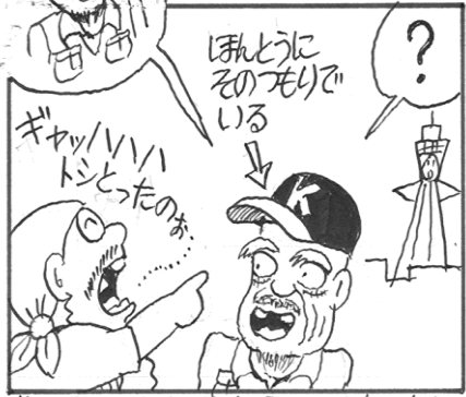
若いおれん、トシとはどういふことか