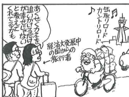
かつての日本人も海外へ先でこう感じただものだ