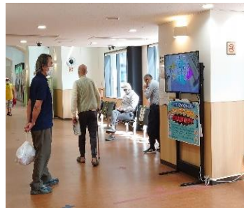
【待ち合いでのPR動画風景】

協力いただいた関係団体の皆様ありがとうございました。センターでは、求職相談や履歴書の作成も支援しています。就職応援フェアに参加できなかった方も、いつでもお気軽にお越しください。