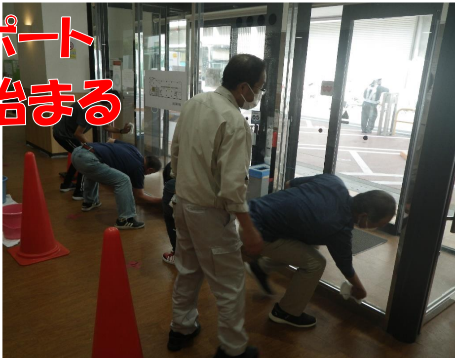
6月10日(金)センターで「マンション清掃体験講習」が実施され、5名の方が受講しました。