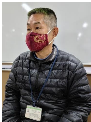
勤めている会社の職員証を身に付け、取材に応じていただいたAさん

訪問介護の仕事は利用者それぞれに合 った方法で接する必要があるため、ひと 通りやり方を覚えても、利用者が変われ ばまた新たな気持ちで勉強し直さなけれ ばなりません。 大変な仕事だと思えますが、自分を必 要とする人がいる限りはやれることをや りたいという思いです。